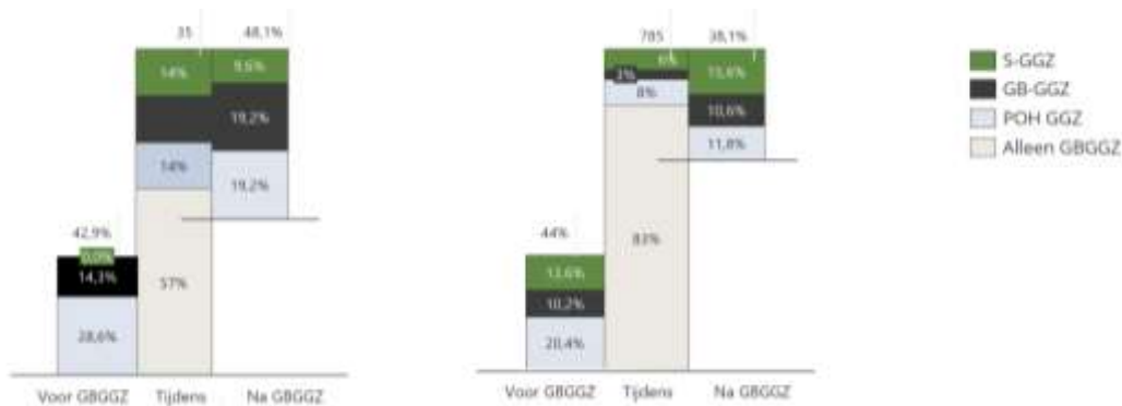
Figuur 3. Cliëntstromen vergeleken met de benchmark.

Naast de aantallen van de eigen praktijk, zijn in de spiegelrapportages de inzichten van vergelijkbare praktijken weergegeven: de benchmarkgroep (voorbeeld: figuur 3).